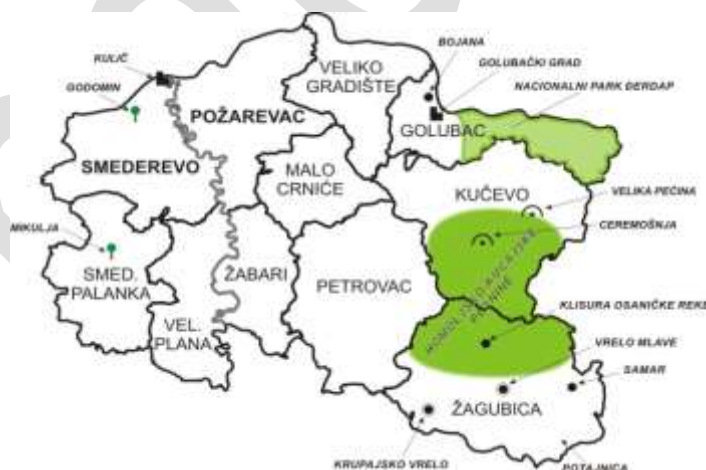
Mapa 3: Prirodni resursi regiona

Dunav, Velika Morava i drugi rečni tokovi, izvori vode (Krupaja, Vrelo Mlave, Ždrelo, Palanački Kiseljak i dr. ), ravnice i planinski Homoljsko-Kučajski predeo, predstavljaju raznoliku i relativno netaknutu životnu sredinu. Najosetljiviji deo prirodnog nasleđa regiona – NP Đerdap je zaštićen, a ključnim prirodnim atrakcijama (Đerdapska klisura, pećine Ceremošnja i Ravništarka, Prerast, Srebrno jezero, ...) nastoji se upravljati u skladu sa principima održivog razvoja.