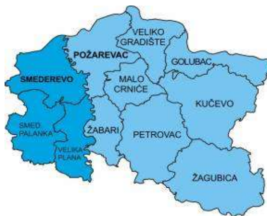
Mapa 2: Opštine Braničevsko-Podunavskog regiona