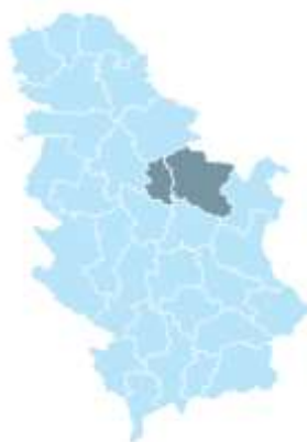
Mapa 1: Braničevsko-Podunavski region u RS