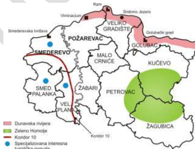
Mapa 4: Indikativne turističke brend-destinacije u regionu